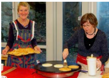
Gode hjelpere på julemessen bidro til kr. 183.000 til menighetenes arbeid.

Diakonen er delvis lønnet av givertjenesten. Hun er tilgjengelig for unge, eldre og andre som trenger et møte med et medmenneske, enten du er på institusjon eller bor hjemme. Ta gjerne kontakt for å gjøre en avtale (telefonnummer nederst på siden).