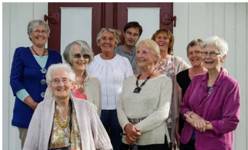
Representanter fra Bygdekvinnelaget, Frikstad Kirkering jubileumskomiteen samt artikkelforfatteren