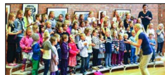
RaBa-koret i Randesund: Mer enn 1500 sangere over 17 år.