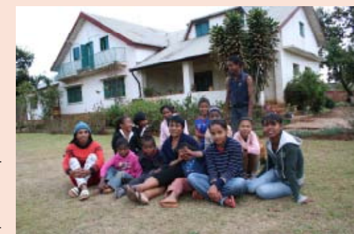
Barn og ansatte ved Ankanisoa.

A lle pengene som kommer inn på Balubadagen går til barnehjemmet Ankanisoa på Madagaskar. På barnehjemmet bor det for tiden 22 barn i alderen 5-18 år. Alle foruten én går på skole. Den ene har spesielle konsentrasjonsvansker og problemer med å følge vanlig undervisning. Han får derfor tilpasset undervisning hjemme på senteret og også spesiell opplæring i arbeidet med landbruk og med husdyra på barnehjemmet. Flere av de andre barna har også vanskeligheter på skolen. De får støtteundervisning av frivillige, ofte tidligere beboere. Nytt i år er at de har fått ferdig muren av murstein rundt eiendommen, så nå er sikkerheten mye bedre. Beboerne har nylig vært på ferie på "høyfjellet". Farimena ligger et stykke opp i høyden utenfor Antsirabe, og en uke der ble en kjærkommen avveksling. Mye lek og latter, bønn, sang, god mat osv. (Fra årsrapporten i NMS 2011 om Sosial innsats i Antsirabe)