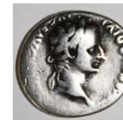
Tiberius, skattens mynt

Disse pengene representerte en stor sum, så mye som verdien på en fullvoksen slave. Som begrep henger "de tretti sølvpenger" igjen i språket som et negativt begrep for svik og bedrag. Mynten kan være den populære Tyre shekel ,