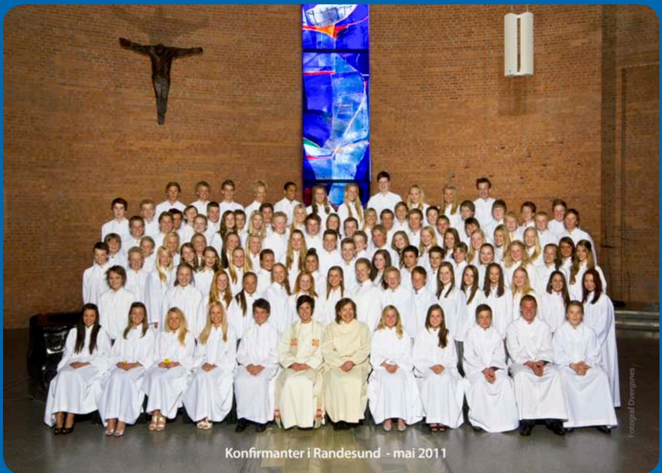
Konfirmanter i Randesund - mai 2011