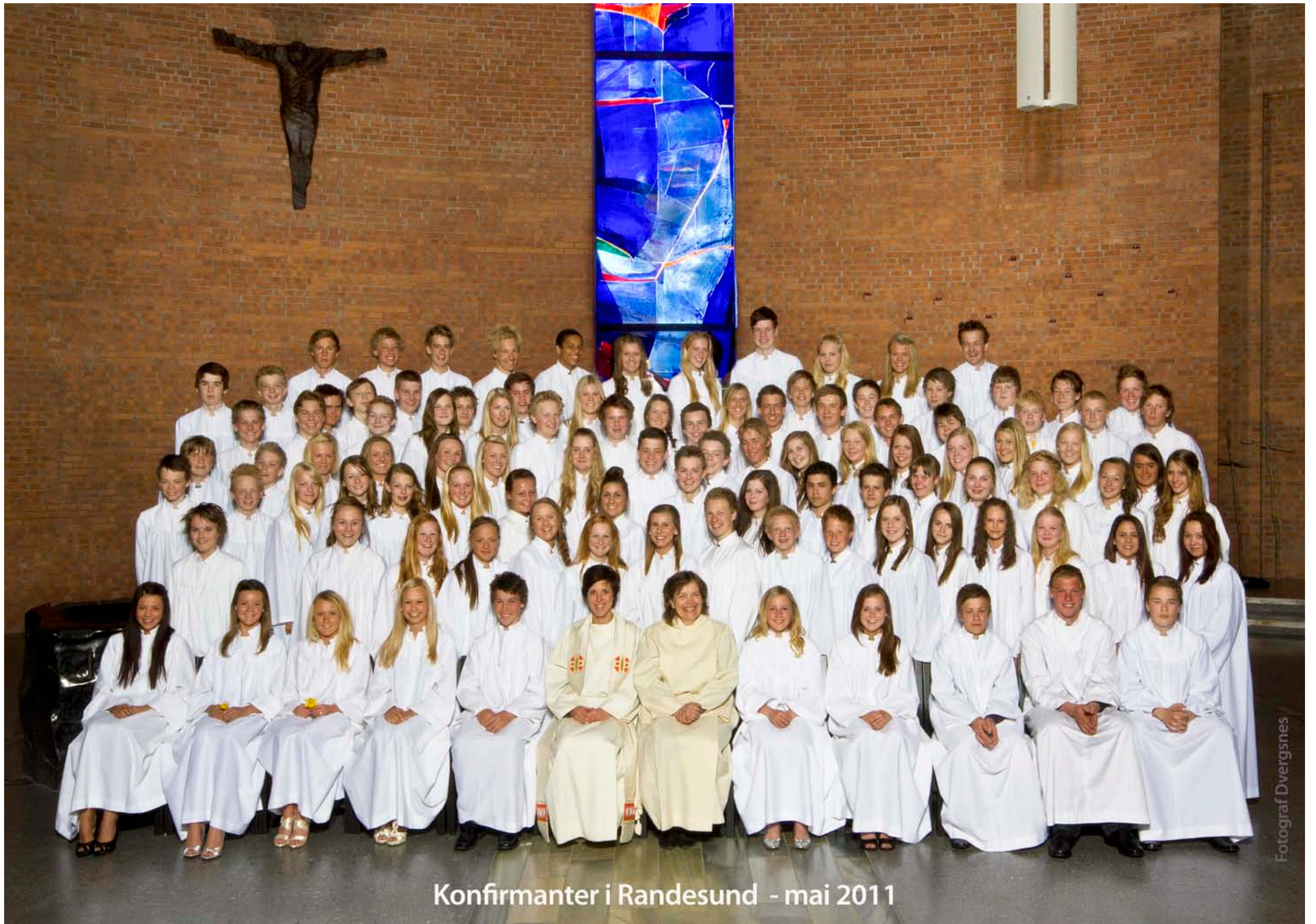
Konfirmanter i Randesund - mai 2011