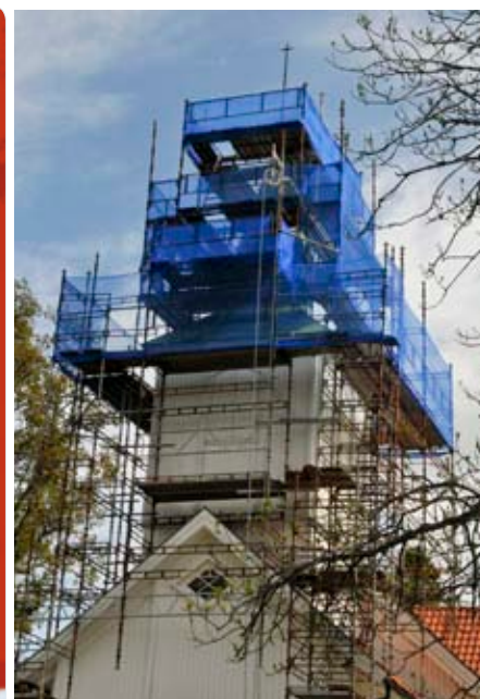
Tårnet på Randesund kirke får nytt kobbertak