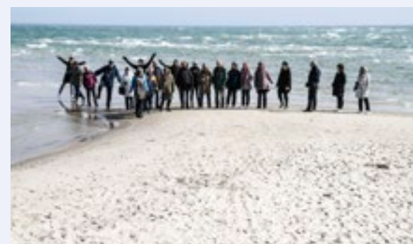
Koret på toppen av Danmark. Det ble tid til både tur, sosialt samvær og korøvelser på den to-dager lange turen.