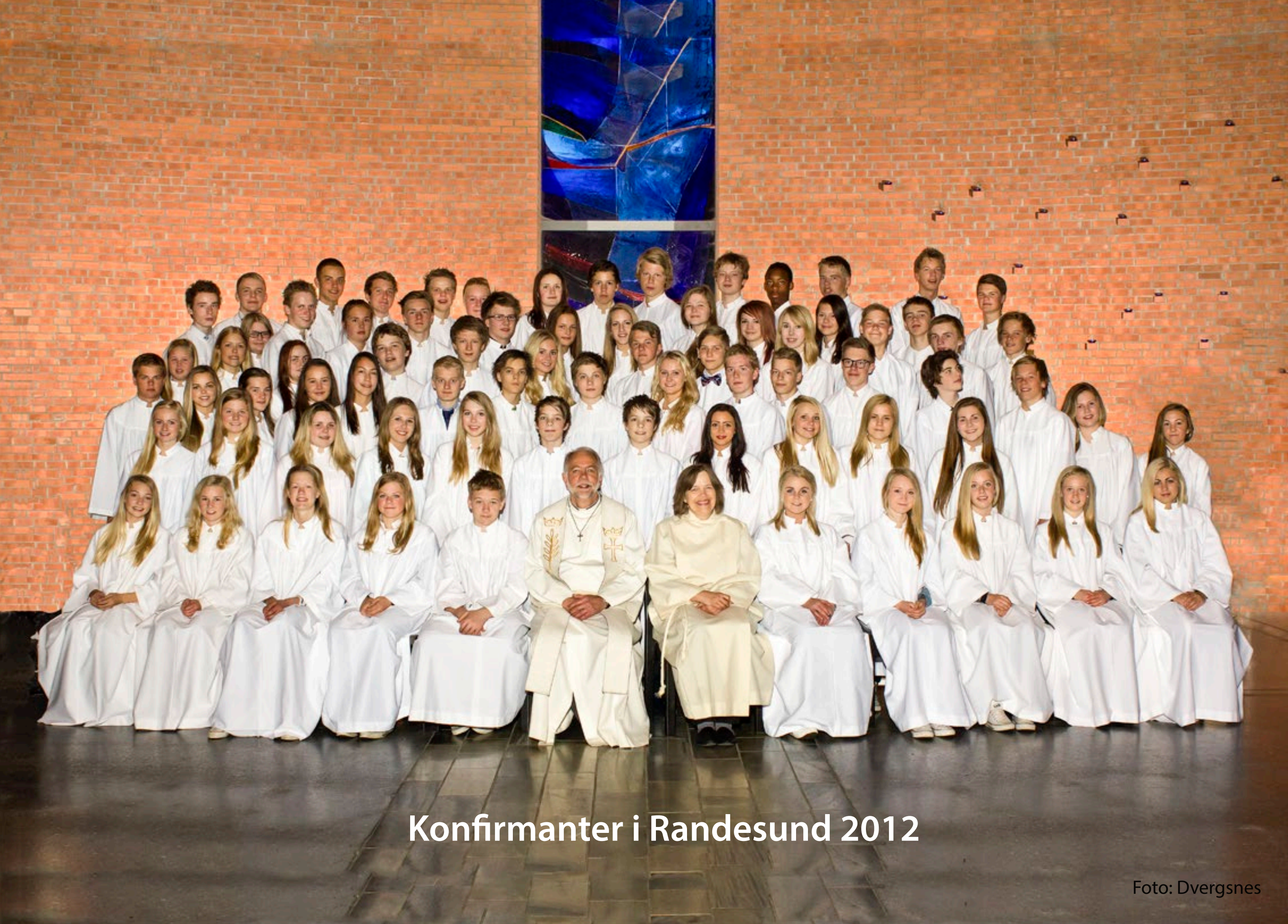
Konfirmanter i Randesund 2012