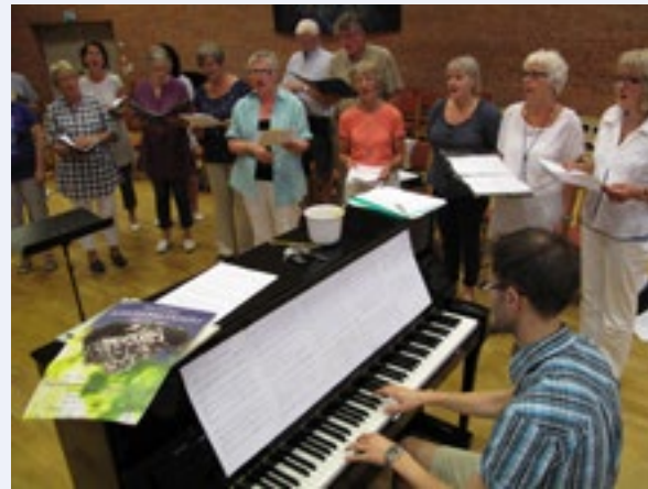
Kor øver til sommerkonserten i Sømkirke