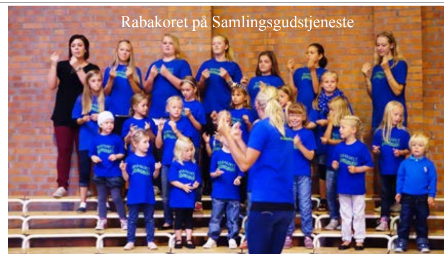
Rabakoret på Samlingsgudstjeneste

Nå er det slik at det faller fra noen givere hvert år, men heldigvis kommer det inn nye. Vi håper på en god høst og anbefaler givertjenesten som en fin tjeneste i menigheten.