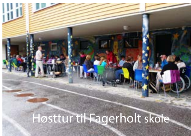
Høsttur til Fagerholt skole

Du er hjertelig velkommen! Vennlig hilsen menighetene i Den norske kirke Kristiansand