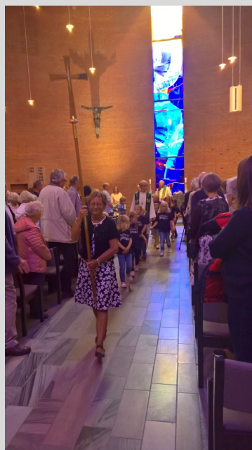
Ni nye faste givere ble vervet på samlingsgudstjenesten