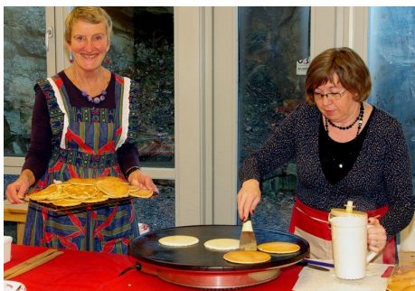
Gode hjelpere på julemessen bidro til kr. 183.000 til menighetenes arbeid.

Diakonen er delvis lønnet av givertjenesten. Hun er tilgjengelig for unge, eldre og andre som trenger et møte med et medmenneske, enten du er på institusjon eller bor hjemme. Ta gjerne kontakt for å gjøre en avtale (telefonnummer nederst på siden).